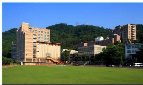
外双溪キャンパス